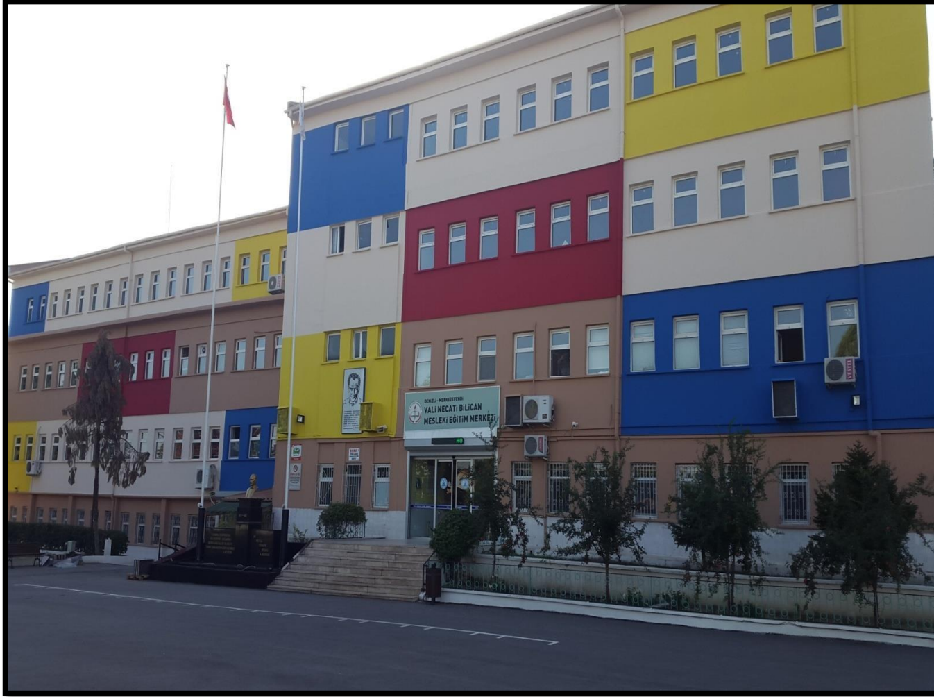
OKULUMUZUN SON HALİ