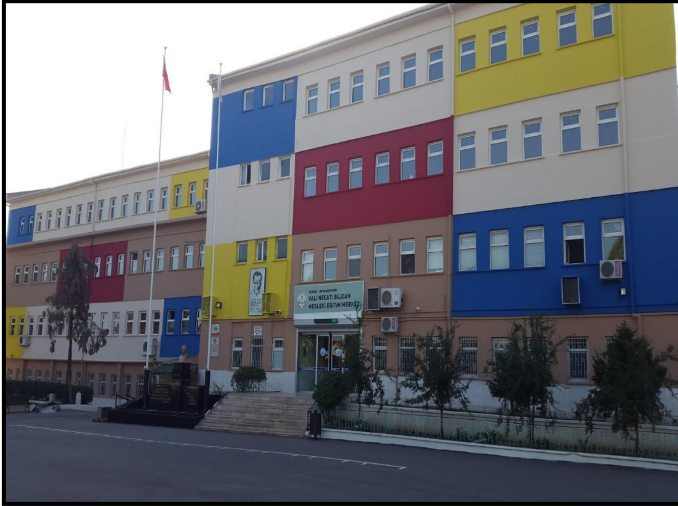
OKULUMUZUN SON HALİ